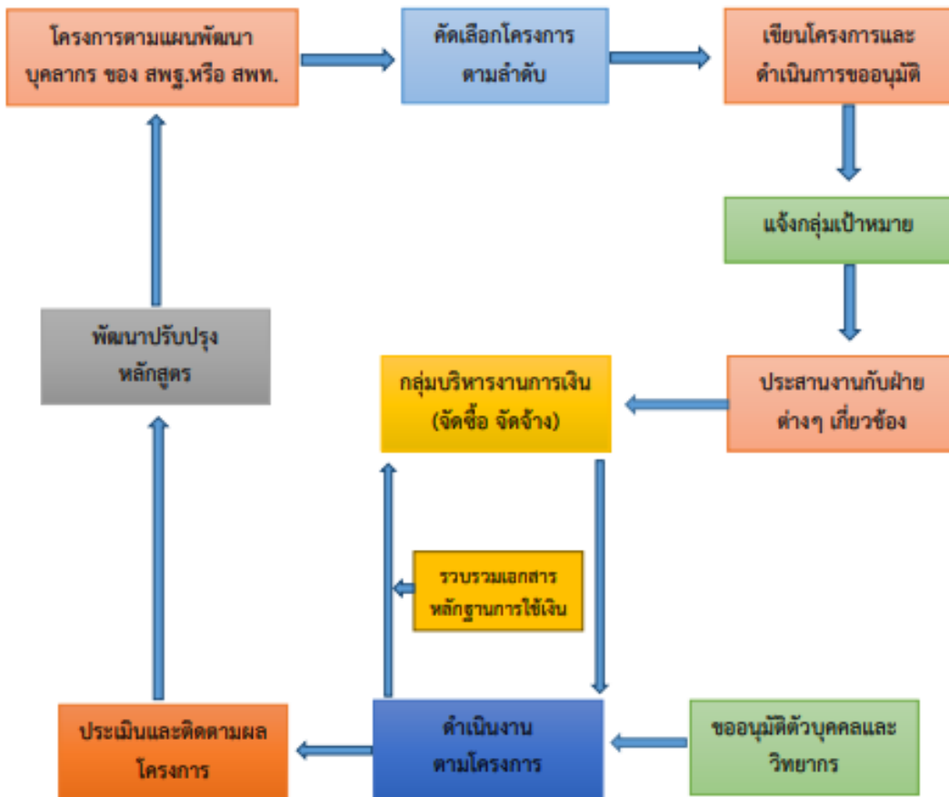
Flow Chart ขั้นตอนการปฏิบัติงานของศึกษานิเทศก์ (การสร้างหลักสูตร,การกำหนดโครงการฝึกอบรม) การบริหารงานโครงการ, การประเมินผลและติดตามผลโครงการ)