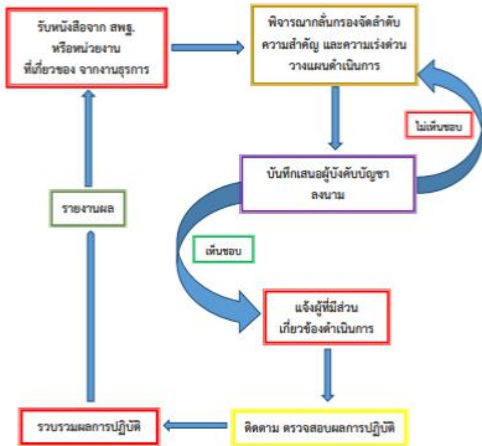
Flow Chart ขั้นตอนการปฏิบัติงานของศึกษานิเทศก์ ด้านเอกสารตามคู่มือการปฏิบัติงานของศึกษานิเทศก์